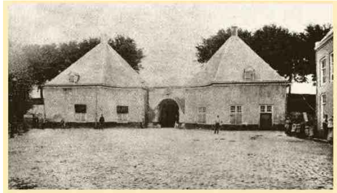
Twee foto's van de Antwerpsche poort (links de buitenzijde, rechts de binnenzijde). De poort en de vestingwerken werden met toestemming van Koning Willem III gesloopt.

Toen dit bericht in Breda aankwam werden 200 kozakken onder majoor Prins Gagarin naar Terheijde gestuurd om de schepen tegemoet te gaan. Later stuurde Van der Plaat nog een patrouille onder leiding van lt.kol Steinmetz, bestaande uit enkele kozakken en Bredasche burgers met gevorderde paarden. Deze vonden inderdaad de kozakken met de schepen: de kozakken hadden een Franse voorpost aangetroffen bij Terheijde, terwijl de schepen verderop lagen. Ze hadden de Franse voorpost verjaagd en daarna hun paarden voor de schepen gespannen. Tegen de avond kwamen zij terug met twee schepen, het ene met negen stukken geschut (12- en 24-ponders) en toebehoren, en het andere met 60.000 pond kruit en kogels. Als de patrouilles later waren geweest, was het geschut wellicht door een patrouille Franse lansiers onderschept, die in de omgeving naar dezelfde schepen op zoek was.