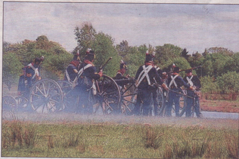
Eind maart al een Napoleontische veldslag in Bathmen.

'Bathmen spant de Kroon' door Barend Breukink, Johan Nahuis, Bertus Kleinen Traast, Haarman en Joop Mol