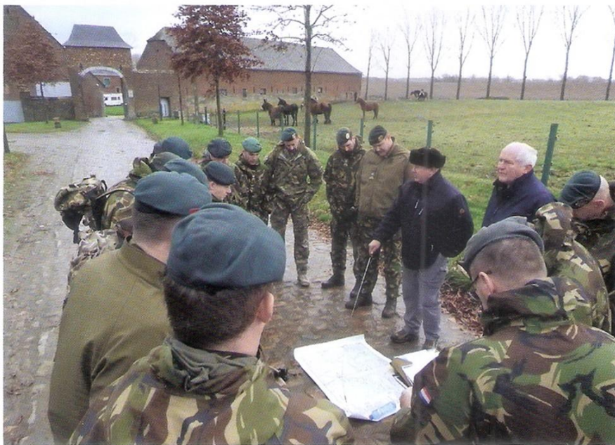
De Limburgse Jagers krijgen uitleg in Quatre Bras

De onderofficieren van de Limburgse Jagers reisden afgelopen november af naar Waterloo en Quatre Bras. Op die plekken hebben in 1815 veldslagen plaatsgevonden waar ook stamonderdelen van de Limburgse Jagers hebben gevochten. De onderofficiersvereniging organiseerde de battlefieldtour om de kennis over de regimentsgeschiedenis uit te breiden, en hun voorgangers te herdenken.