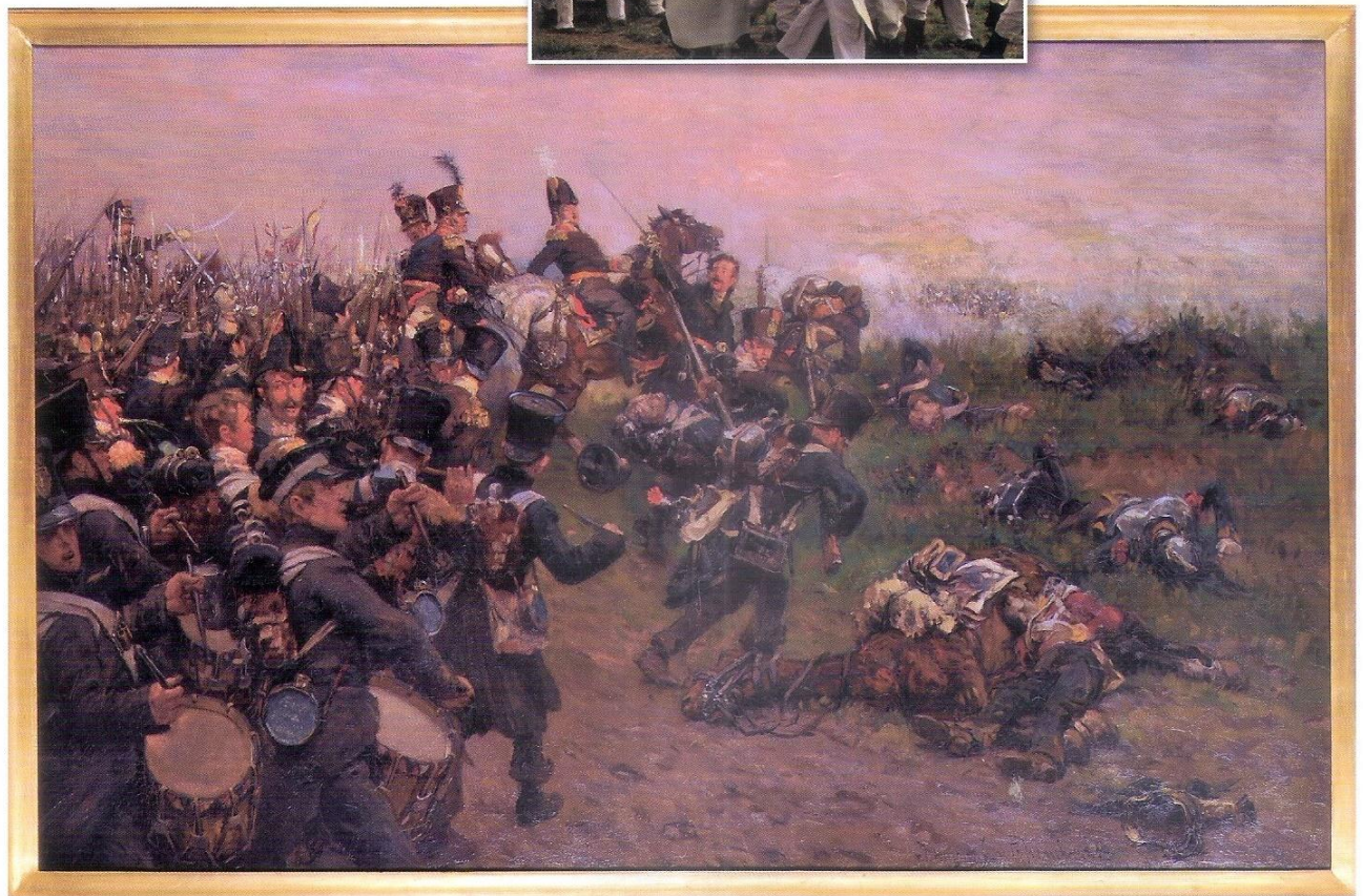
2e bataljon van Linie met luitenant-kolonel Spielman aan het hoofd aangespoord door Generaal Chassé zet de aanval in.