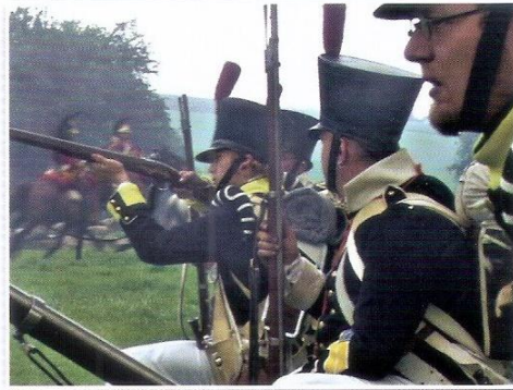
Beelden van de re-enactment in 2015 200 jaar nadien met leden van de 2e Grenadiercompagnie 2e Bataljon van Linie

Vaderland ons leven veil hebben. Voorwaarts!', zo klonken de woorden van Chassé om zijn mannen nog eenmaal te begeisteren. Onder tromgeroef stormden de infanteristen voorwaarts. 'Leve de koning! Oranje boven!' De Nederlandse colonnes stootten volop de Franse Gardebataljons in. De 3e Divisie, waartoe dus ook het 2e Bataljon Infanterie van Linie behoorde, viel de Fransen succesvol in de flank aan. De Franse soldaten van het 3ème en 4ème Grenadiers zwichtte onder het offensief en kozen het hazenpad. >>