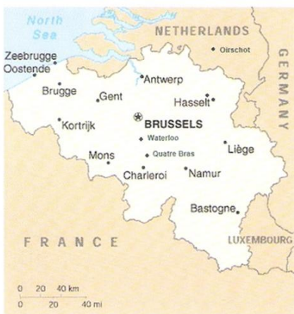
Waterloo en Quatre Bras op de kaart